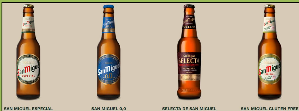
SAN MIGUEL ESPECIAL